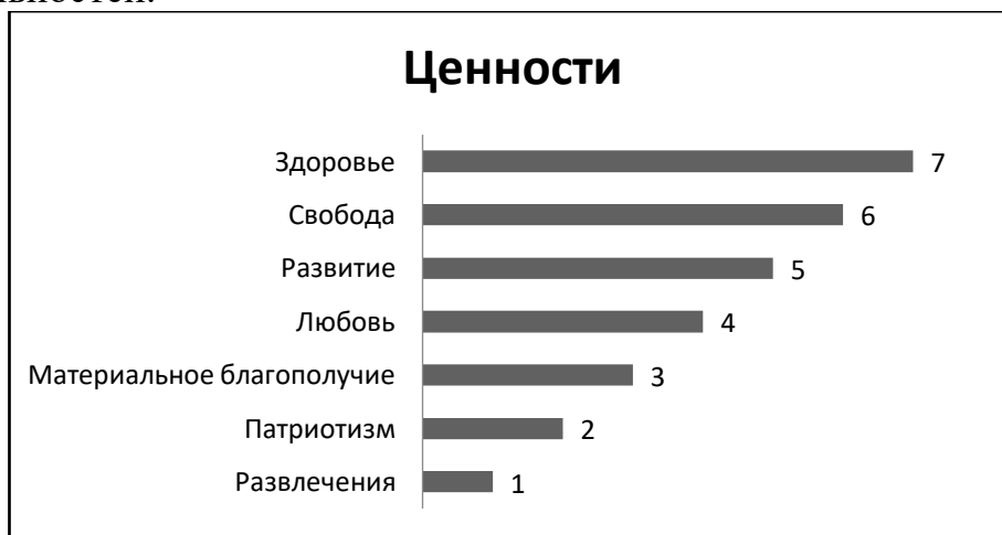
Рис. 1. Иерархия ценностей студентов колледжа

В исследовании приняли участие более 100 студентов первого и второго курсов ГПОУ «Кузбасского колледжа культуры и искусств им. И.Д. Кобзона» всех специальностей.